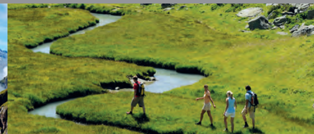
Les montagnes - Clés d'un avenir durable

Le cadre social, économique et environnemental du monde d'aujourd'hui est en constante transformation. Pour survivre, chaque organisation se doit de réagir et de s'adapter à ces changements.