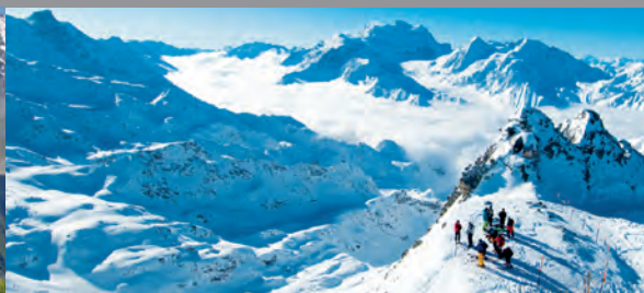
Mercredi 11 décembre 2013