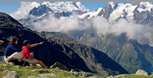
Le Châble (VS)